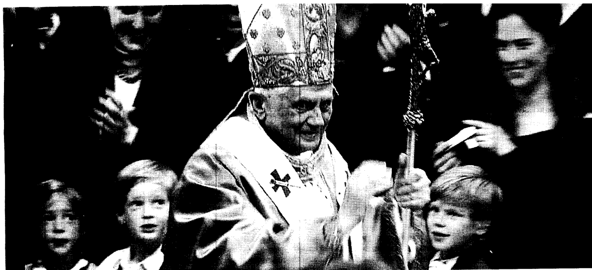
Il Papa tra i fedeli, sempre vicino alle famiglie